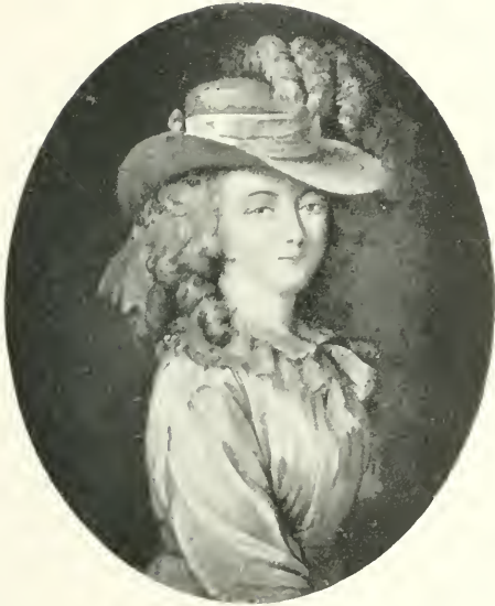
MADAME DU BARRY